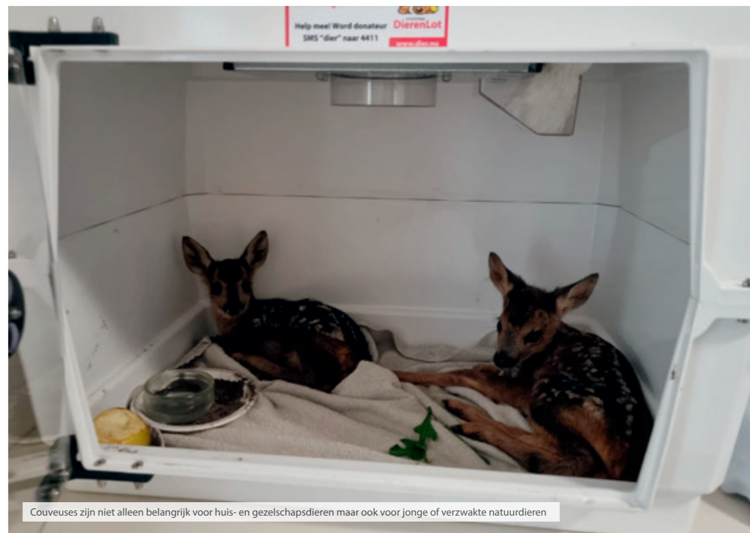
Couveuses zijn niet alleen belangrijk voor huis- en gezelschapsdieren maar ook voor jonge of verzwakte natuurdieren