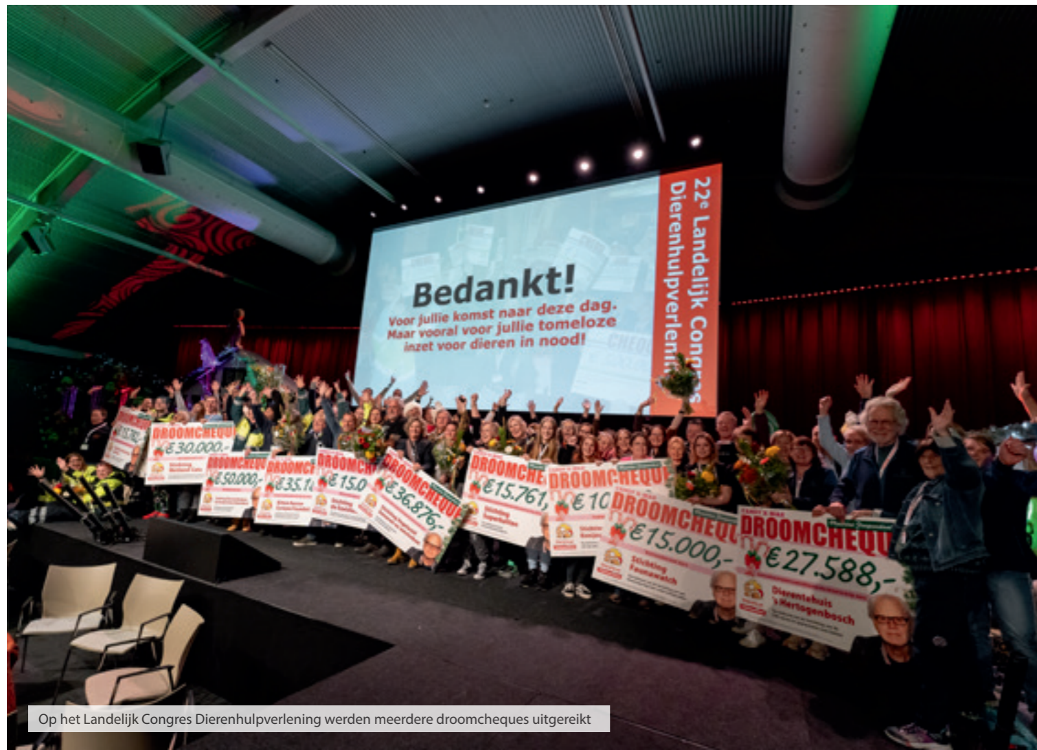
Op het Landelijk Congres Dierenhulpverlening werden meerdere droomcheques uitgereikt

Eind 2023 is besloten vanwege de toegenomen kosten in het algemeen de uitkeringen te verhogen tot maximaal € 10.000 per geval.