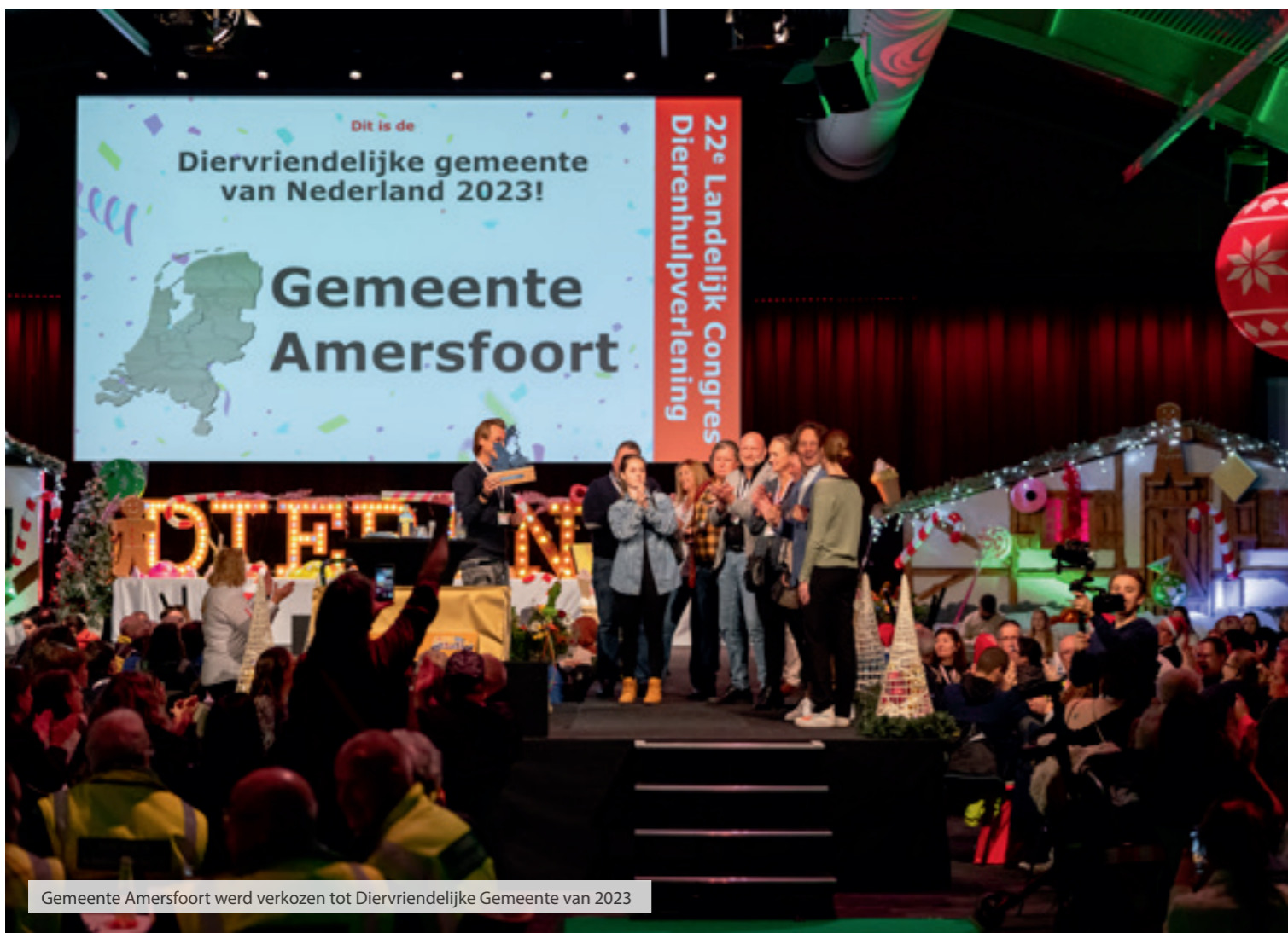
Gemeente Amersfoort werd verkozen tot Diervriendelijke Gemeente van 2023