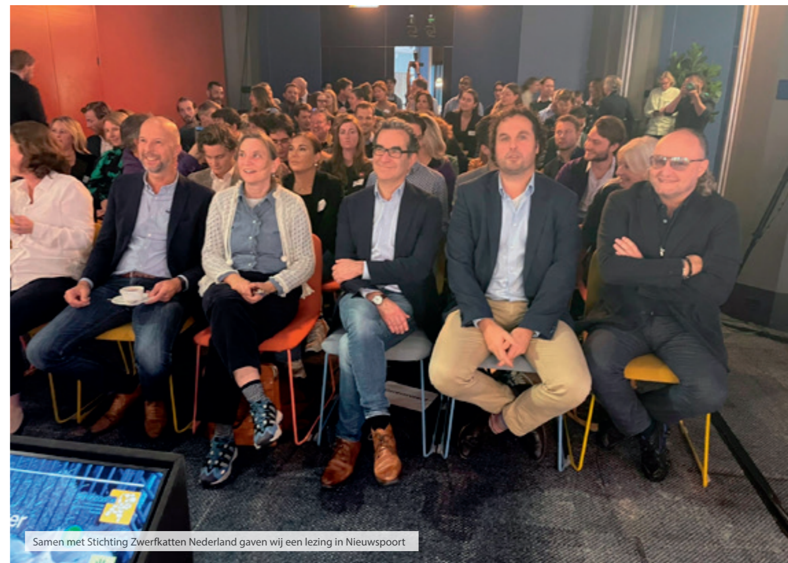
Samen met Stichting Zwerfkatten Nederland gaven wij een lezing in Nieuwspoor

Zo zijn onze handvatten voor Vogelgriep de landelijke leidraad geworden. Dat is niet gek, want die handvatten zijn samen met de mensen in het veld samengesteld. Ze kloppen dus én zijn werkbaar voor iedereen. Met het Ministerie van Landbouw, Natuur en Voedselkwaliteit (LNV) is een financiële tegemoetkoming afgesproken voor de lokale dierenwelzijnsorganisaties én een bijdrage in natura bestaande uit materialen zoals medische mondkapjes, schorten en andere beschermingsmiddelen