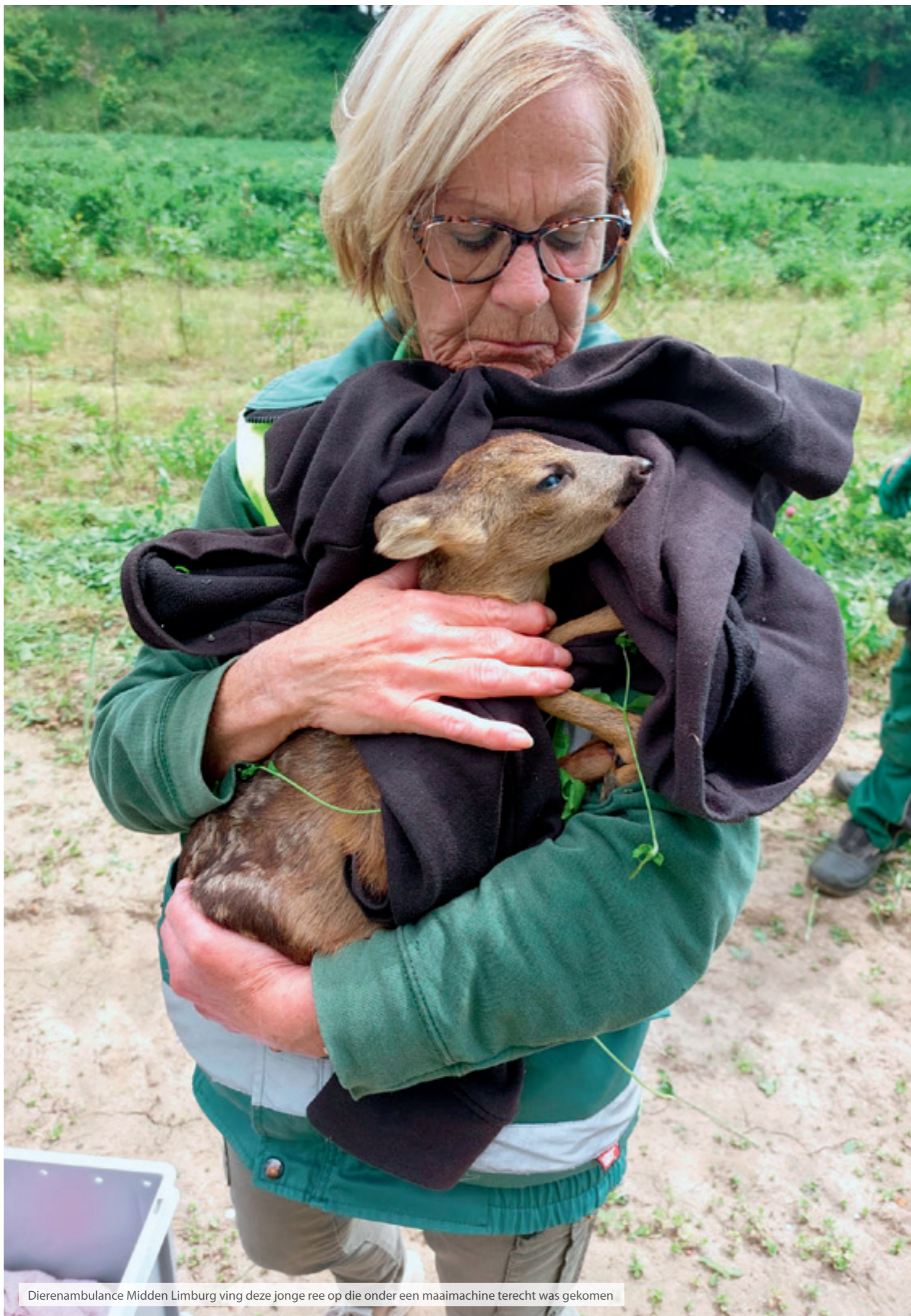
Dierenambulance Midden Limburg ving deze jonge ree op die onder een maaimachine terecht was gekomen

DierenLot ondersteunt lokale en regionale dierenhulporganisaties door heel Nederland, omdat wij de vaste overtuiging hebben dat dierenhulp zoveel mogelijk lokaal geregeld moet worden. Wij zijn een groot voorstander van een fijnmazig netwerk van dierenhulporganisaties en ondersteunen juist daarom deze lokale en regionale organisaties.