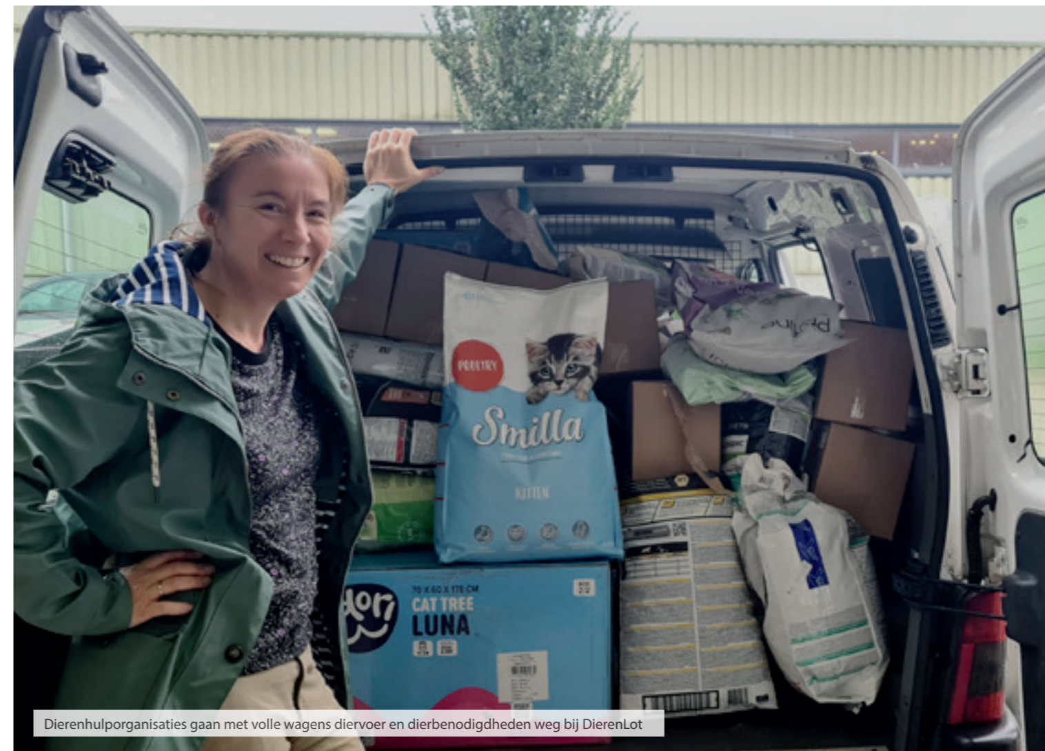
Dierenhulporganisaties gaan met volle wagens diervoer en dierbenodigdheden weg bij DierenLot

bijdrage in de onderhoudskosten van de wat oudere auto's. Op deze Landelijke Bijeenkomsten bieden we ook rijvaardigheid trainingen aan voor dierenambulance bestuurders. Zo kan geoefend worden met inparkeren of met achteruit rijden. Hierdoor kunnen we schades aan de auto's beperken.