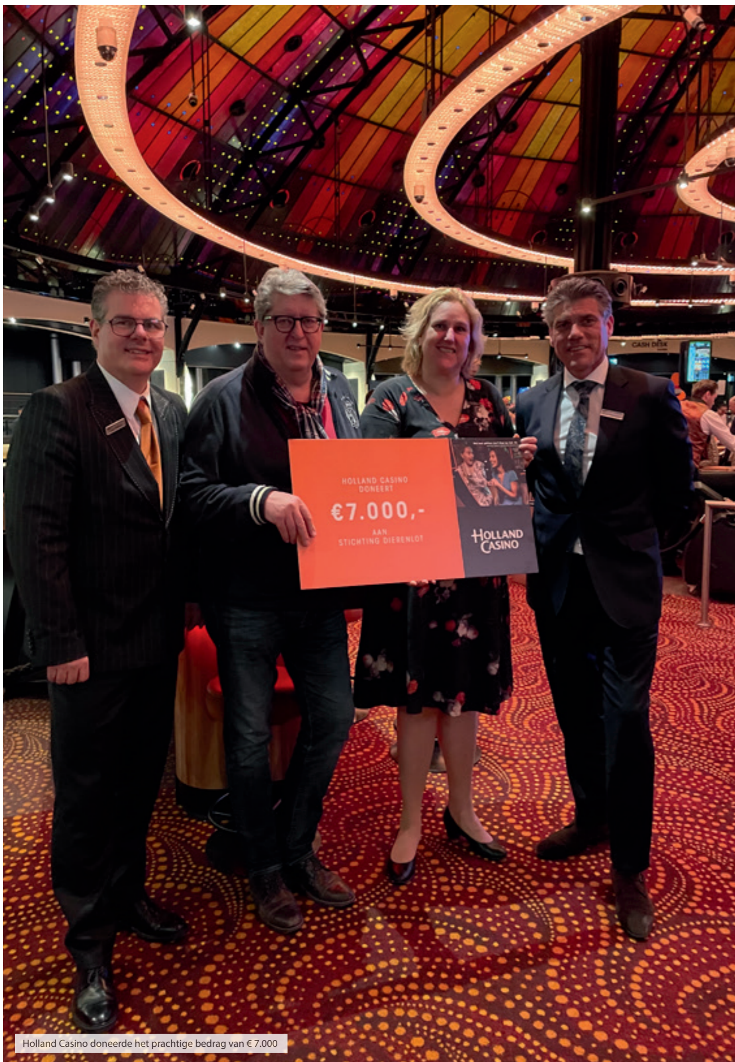
Holland Casino doneerde het prachtige bedrag van € 7.000

Naast het diervoer dat wij van veel leveranciers hebben ontvangen, mochten wij ook mooie