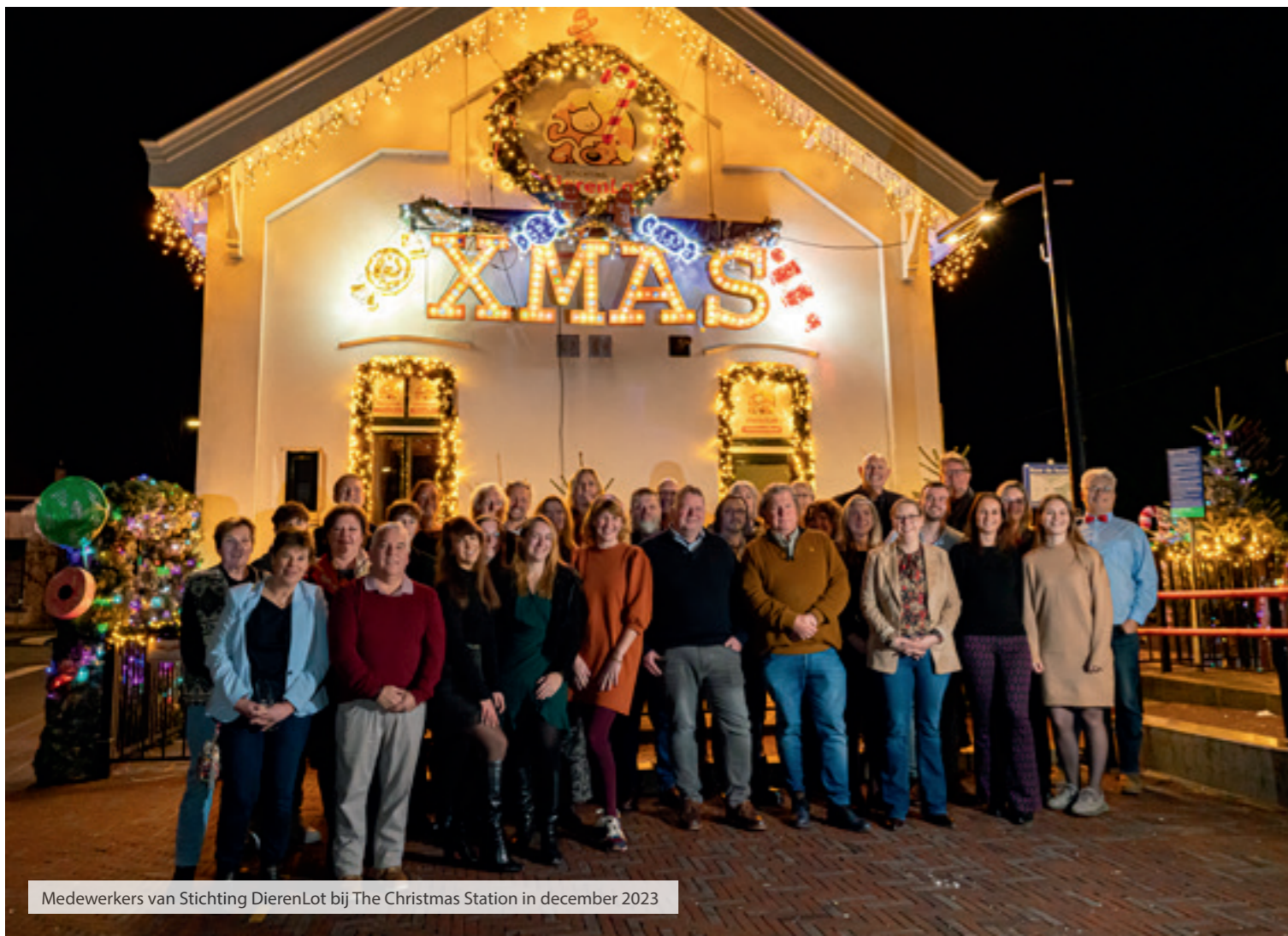
Medewerkers van Stichting DierenLot bij The Christmas Station in december 2023

en deze organisaties bij te staan in de soms moeizame aanloop naar nieuwe cont(r)acten met de gemeenten en andere overheden. Voor de begroting verwijzen wij naar de jaarrekening. De begroting van 2024 is goedgekeurd door de Raad van Toezicht tijdens de vergadering van november 2023.