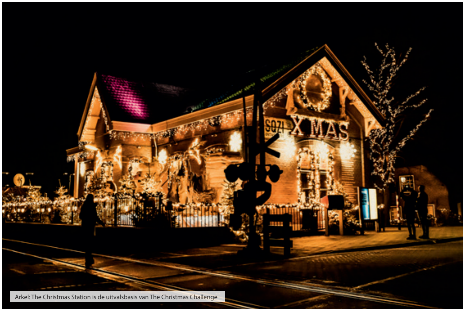
Arkel: The Christmas Station is de uitvalsbasis van The Christmas Challenge