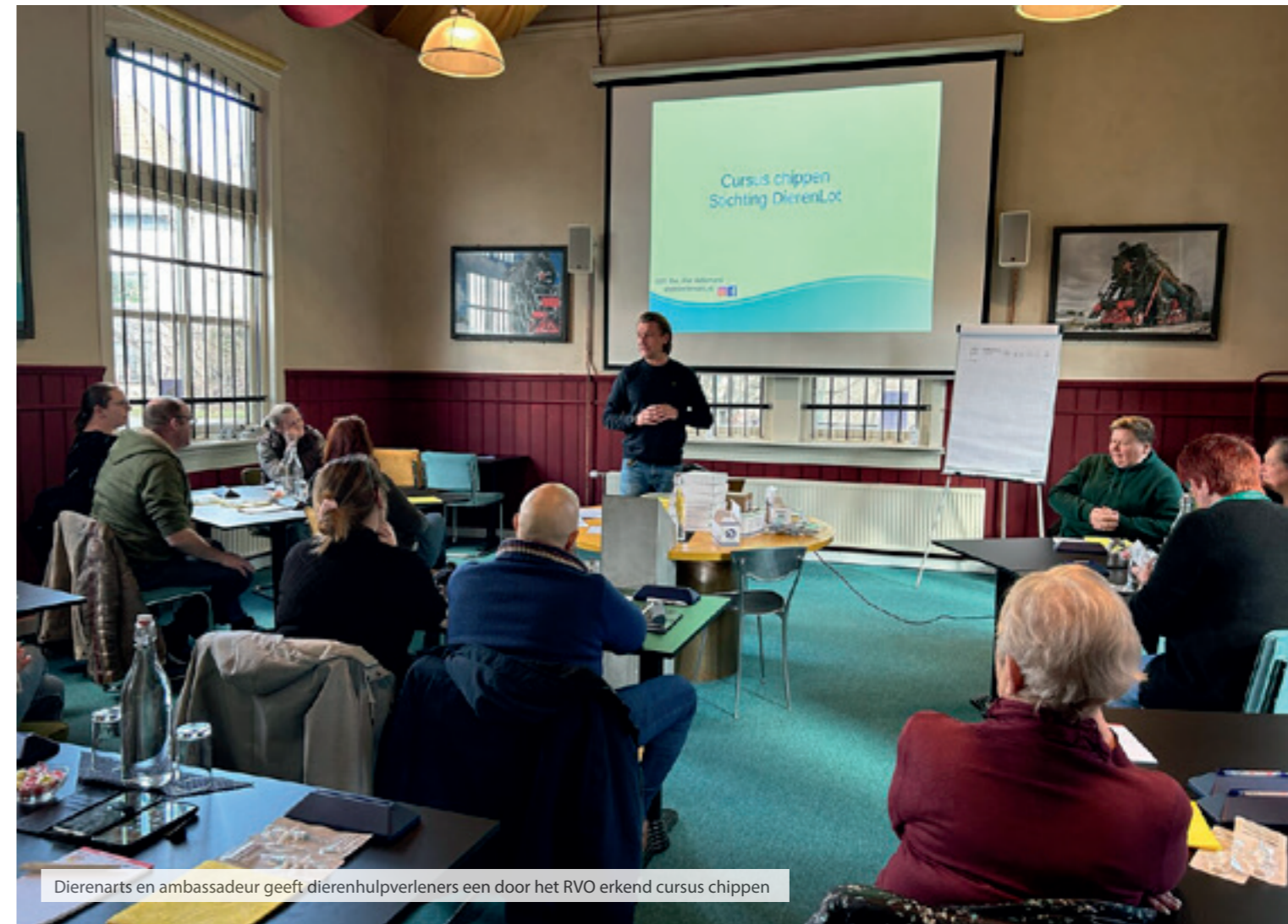
Dierenarts en ambassadeur geeft dierenhulpverleners een door het RVO erkend cursus chippen

Nederland en niet primair op landbouwdieren en vegetarische lobby.