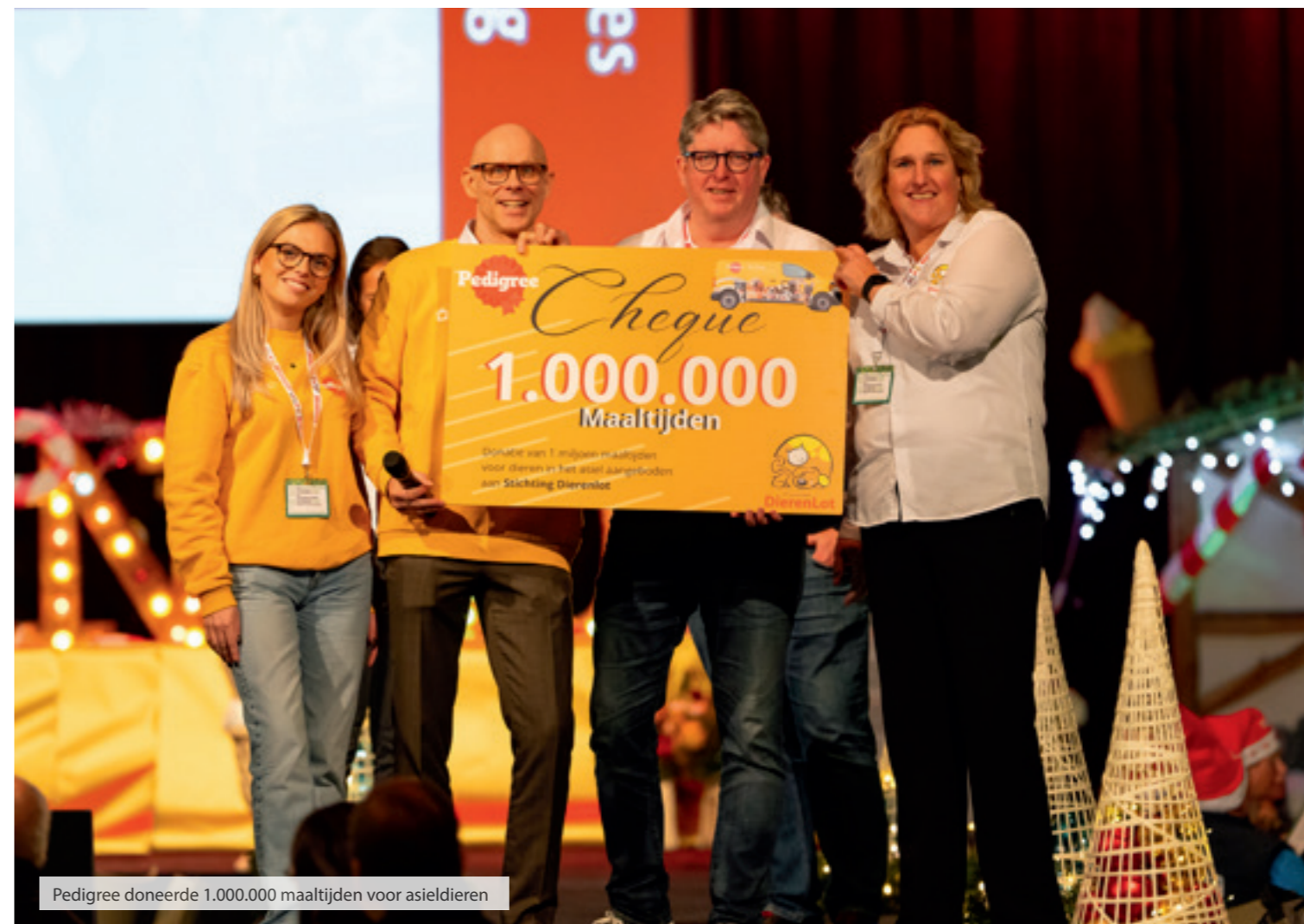
Pedigree doneerde 1.000.000 maaltijden voor asiëdieren

Zo ontvingen wij ook regelmatig aanvragen voor de aanschaf van couveuses. Juist door deze aanvragen te bundelen konden wij kostenvoordeel behalen en de couveuses ter beschikking stellen aan dierenhulporganisaties. In 2023 hebben wij 59 couveuses uitgereikt.