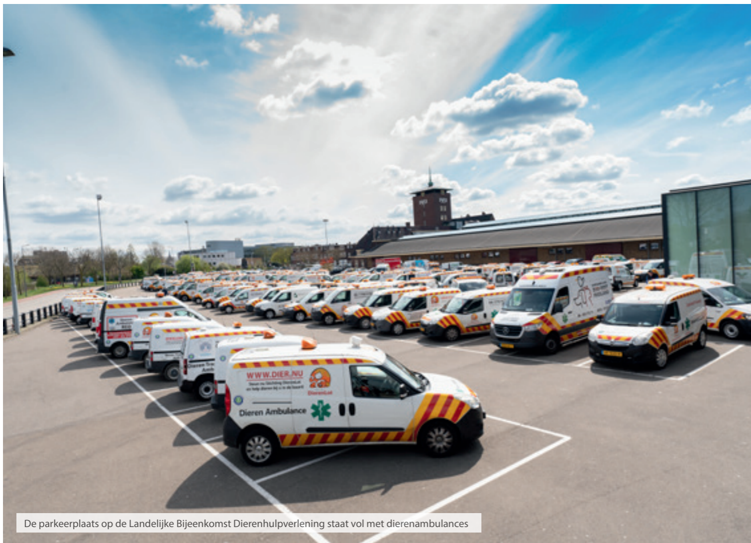
De parkeerplaats op de Landelijke Bijeenkomst Dierenhulpverlening staat vol met dierenambulances