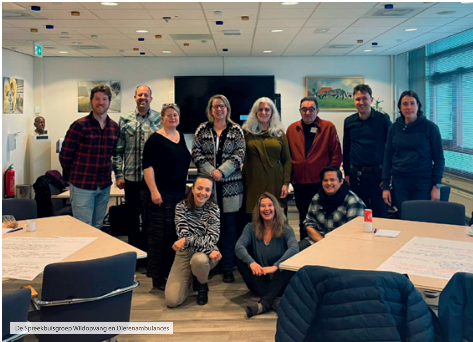
De Spreekbuisgroep Wildopvang en Dierenambulances