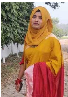
Jongeren die inmiddels