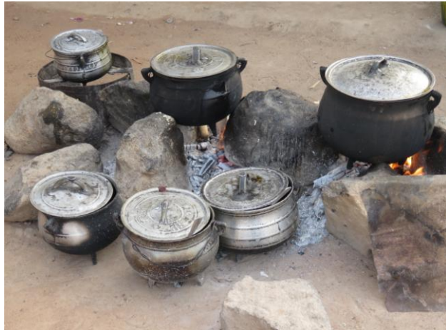
Buitenkeuken met hoge vuurplaten