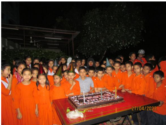
Koningsdag vieren in het HCH