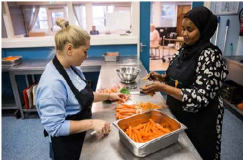
▲ In de keuken van een Rotterdamse school wordt ontbijt gemaakt voor de leerlingen, omdat sommigen met een lege maag naar school komen.

Ook waren we te zien in het Jeugdjournaal, toen we met 1500 leerlingen van scholen van het Jeugdeducatiefonds naar de musical Aladin gingen. Veel van deze leerlingen waren nog nooit in het theater geweest.