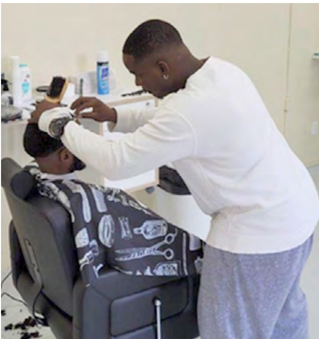
Barbershop van de Capriles Kliniek op Curaçao geopend met bijdrage vanuit Fundashon Boy Winkel

Fundashon Boy Winkel geeft financiële steun aan activiteiten voor resocialisatie en rehabilitatie van psychiatrische patiënten op Curaçao. In 2023 hebben we geen projecten gefinancierd vanuit Fundashon Boy Winkel.