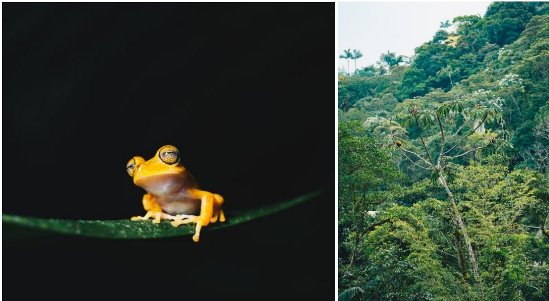
De regio waarin Merazonia is gevestigd is uniek qua flora en fauna die je er kunt vinden.

In 2022 is bijvoorbeeld Merazonia's trapcameraonderzoek uitgebreid naar andere plekken in deze corridor. De verwachting is dat dit heel veel interessante data op gaat opleveren qua bewegingspatronen van wilde dieren. En het geeft hopelijk ook de variëteit en kwantiteit van dieren in de zone weer.