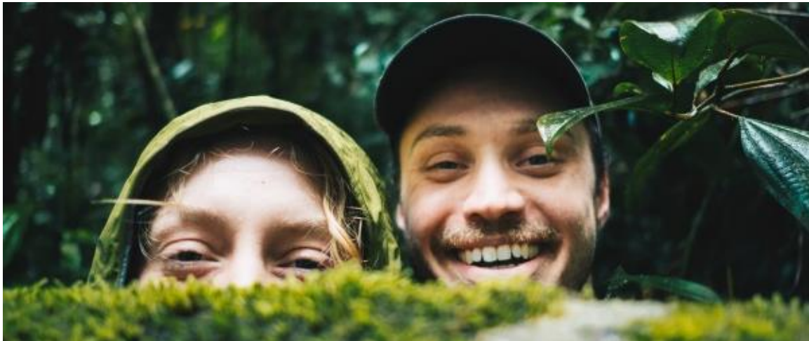
Namens iedereen betrokken bij Merazonia: bedankt voor het lezen van dit verslag en tot volgend jaar!

Stewart MacLean: bedankt voor het aanleveren van bijna alle foto's voor dit jaarverslag.