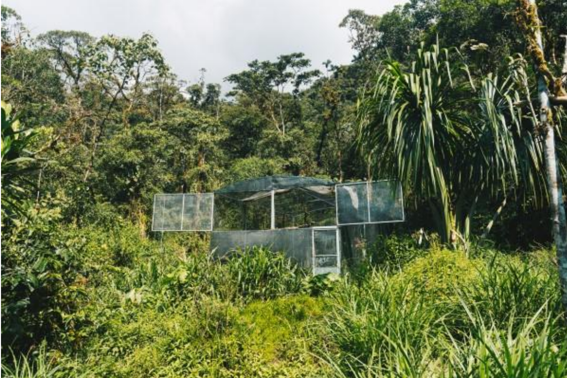
Her roofvogelverblijf is een eigen ontwerp, met als doel roofvogels te kunnen huisvesten, rehabiliteren en vrijlaten in hetzelfde verblijf.

De ligging is ideaal omdat we dieren hier makkelijk in de gaten kunnen houden maar ze tegelijkertijd wel verwijderd zijn van de meeste menselijke activiteiten.