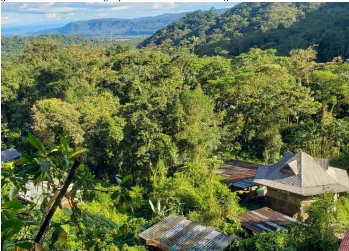
Zicht op de Amazone en de Pastazavallei vanuit Merazonia.

Verder draagt de stichting altijd bij aan de verzorging van neonaten en dieren in rehabilitatie. Indien nodig zal ook geld worden vrijgemaakt voor de altijd voortdurende renovatie van gebouwen en onderkomens in de jungle. Mogelijk kan ook een nieuw onderkomen worden gebouwd en het zonne-energiesysteem eventueel worden uitgebreid of verbeterd.