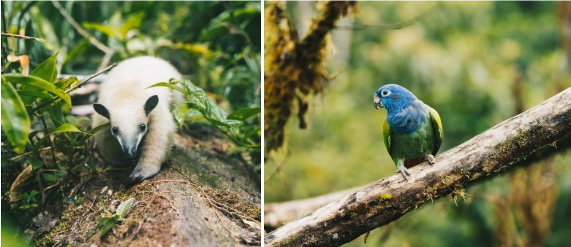
Federico de miereneter en deze blauwkoppapegaaai, leven nu vrij in het reservaat van Merazonia.

Later komen we terug op de investering van een onderkomen speciaal voor roofvogels. We staan er nu al even bij stil omdat deze in 2022 namelijk al ad hoc gebruikt werd om een groep van 7 blauwkop papegaaien vrij te laten. De locatie van de kooi was hiervoor ideaal. De vrijlating werd een succes. Alle vogels wisten zich na een periode van gewenning, waarin ze in en uit de rehabilitatiekooi konden vliegen, aan te passen aan het vrije leven. Een vogel bleef wel vaak terugkomen en wordt nog gemonitord door personeel van het centrum. Maar hij verkeert in goede fysieke gezondheid. Een vrijlating volledig mogelijk gemaakt door fondsen van de stichting!