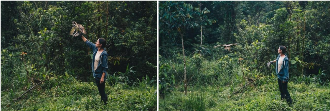
Beelden van de vrijlating van een gestreepte ransuil in Merazonia.

Verder zijn de volgende dieren gerehabiliteerd en vrijgelaten: 1 groep tamarinaapjes, 4 boa's, 7 luiaards (2 tweevingerige en 5 drievingerige luiaards), 1 stekelvarken en 1 wegbuizerd. Ook de gestreepte ransuil te zien op de foto's hieronder is succesvol teruggezet in het wild. Totaal: 27