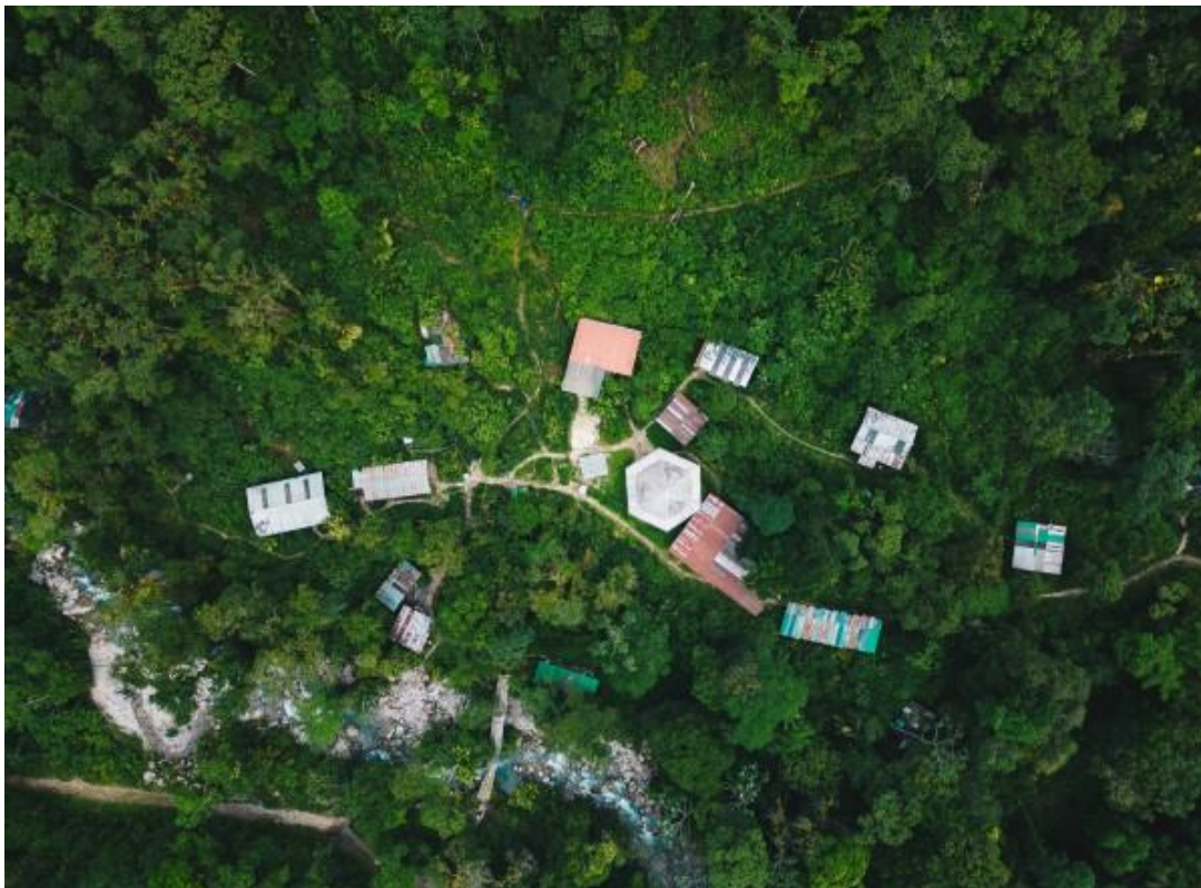
Merazonia grenst aan de kristalheldere Tigre rivier en ligt middenin in het regenwoud.