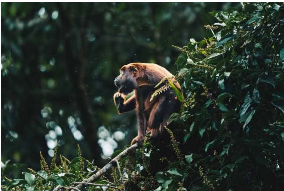
Een gerehabiliteerde brulaap, die nu met haar groep in vrijheid leeft in het reservaat van Merazonia.