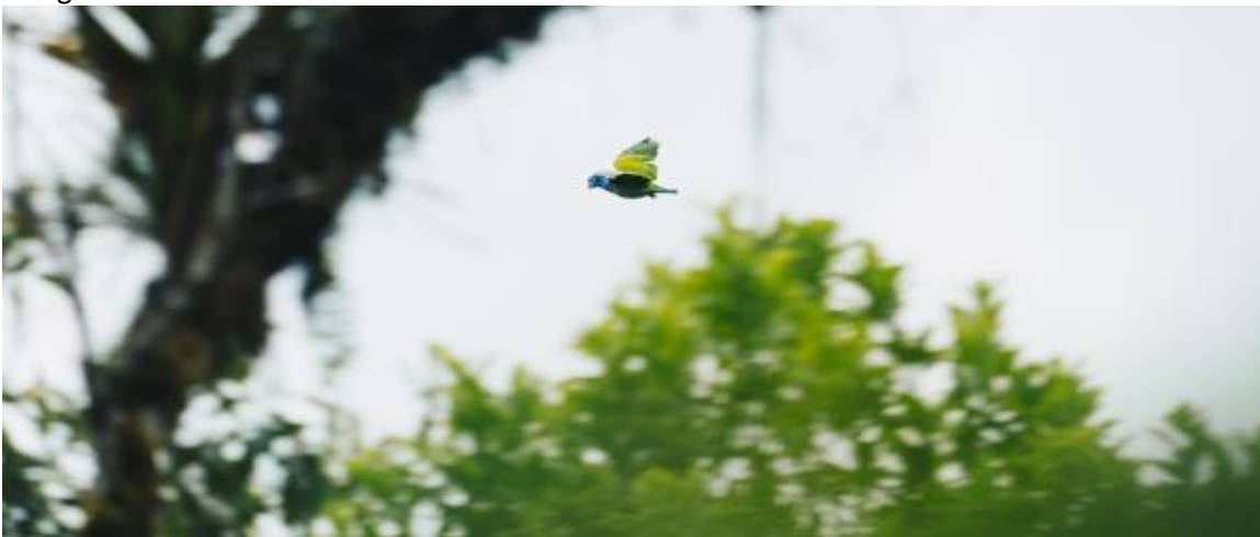
Een blauwkoppagaai vliegt vrij rond in Merazonia na een succesvolle rehabilitatie.

Het bestuur van de stichting Merazonia en alle medewerkers van het opvangcentrum in Ecuador willen wederom nederig hun dank uitspreken aan alle mensen die gedoneerd hebben dit jaar of op andere manier steun hebben verleend aan onze dierenprojecten in de Amazone. Zonder jullie zou er simpelweg geen Merazonia zijn en zouden veel dieren nooit de kans gekregen hebben terug te keren in de natuur.