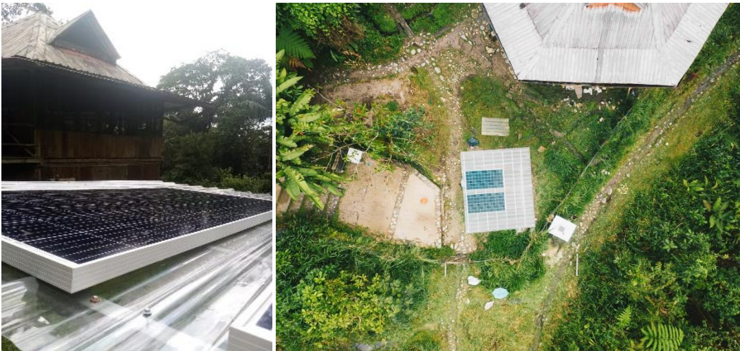
De installatie van zonne-energie kan Merazonia maandelijks 100 dollar besparen aan kaarsen.

In 2023 worden ook de kliniek, de overige cabañas en de vrijwilligerskeuken aangesloten op dit systeem. Dit kan Merazonia in de toekomst maandelijks zo'n 100 dollar besparen. Dat is ongeveer het bedrag dat nu wordt uitgegeven aan kaarsen om licht te brengen in de jungle. Geld dat dus in de toekomst naar dierenprojecten kan. Aan de verbetering en uitbreiding van het zonne-systeem zijn extra kosten verbonden die de stichting mogelijk (deels) op zich zal nemen.