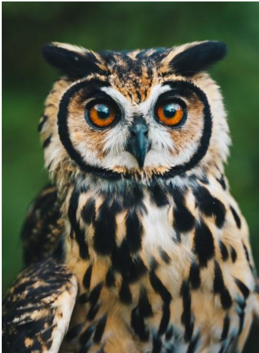
Een in Merazonia gerehabiliteerde gestreepte ransuil, vlak voor zijn vrijlating