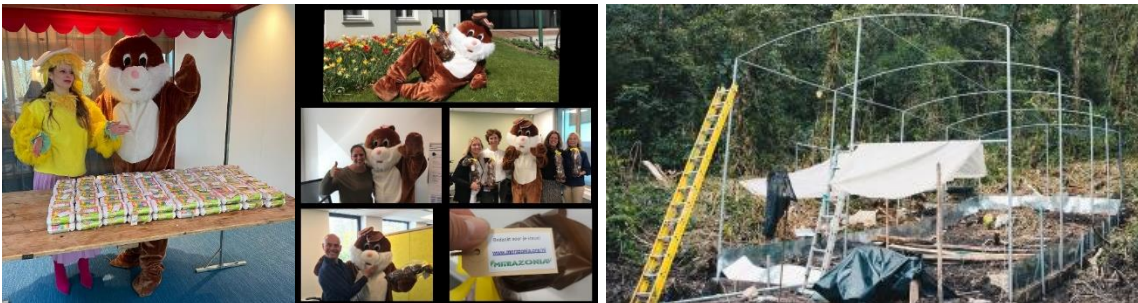
Dankzij de paas- en sinterklaasacties konden nieuwe projecten voor Merazonia worden bekostigd.