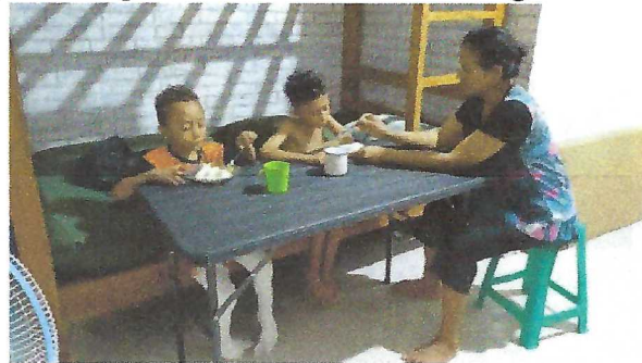
Gehandicapten blij met de nieuwe inrichting.