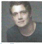
Y v Vessem