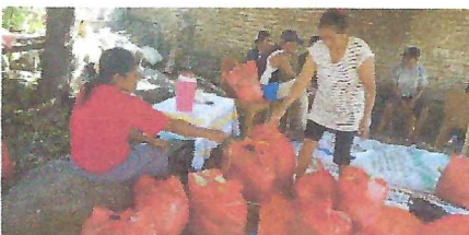
Tassen worden klaargemaakt om uit te delen in afgelegen kampongs.