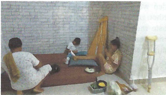
Gehandicapten redden zich op de grond.

Marthon, Mieke, Grasi, Yance en anderen vangen gehandicapte kinderen uit weinig draagkrachtige gezinnen op, die op Flores geen adequate medische behandeling kunnen