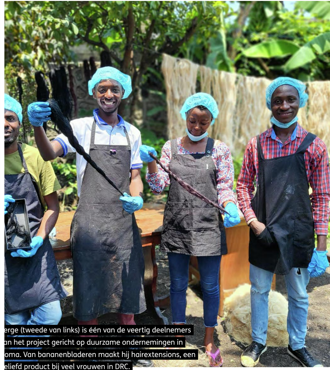
De man in het midden (tweede van links) is één van de veertig deelnemers aan het project gericht op duurzame ondernemingen in Goma. Van bananenbladeren maakt hij harextensions, een geliefd product bij veel vrouwen in DRC.

Vanwege gewelddadigheid door de militiegroep M23 in de provincie Noord-Kivu sloegen tienduizenden mensen op de vlucht. Samen met PPSSP hebben we noodhulp geboden aan 2.965 mensen, met name op het gebied van hygiëne- en sanitaire voorzieningen.