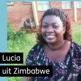
Lucia uit Zimbabwe

produceert, wordt maar 20% gerecycled. Het overige plastic belandt op een grote hoop of wordt verbrand. Charles Bakolo is betrokken bij het Malawi Creation Care Network en zet zich in voor een duurzaam beleid van overheid en bedrijven.