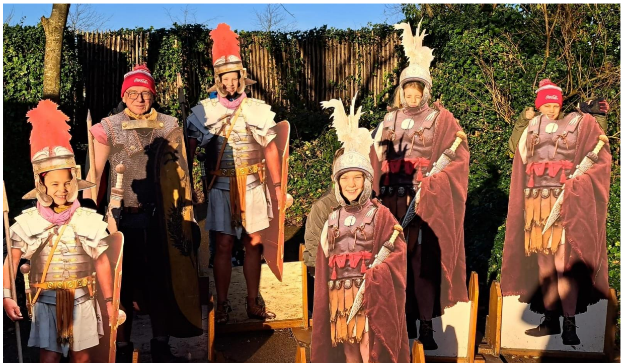
WinterFUNdag december 2023 in het museum themapark Archeon