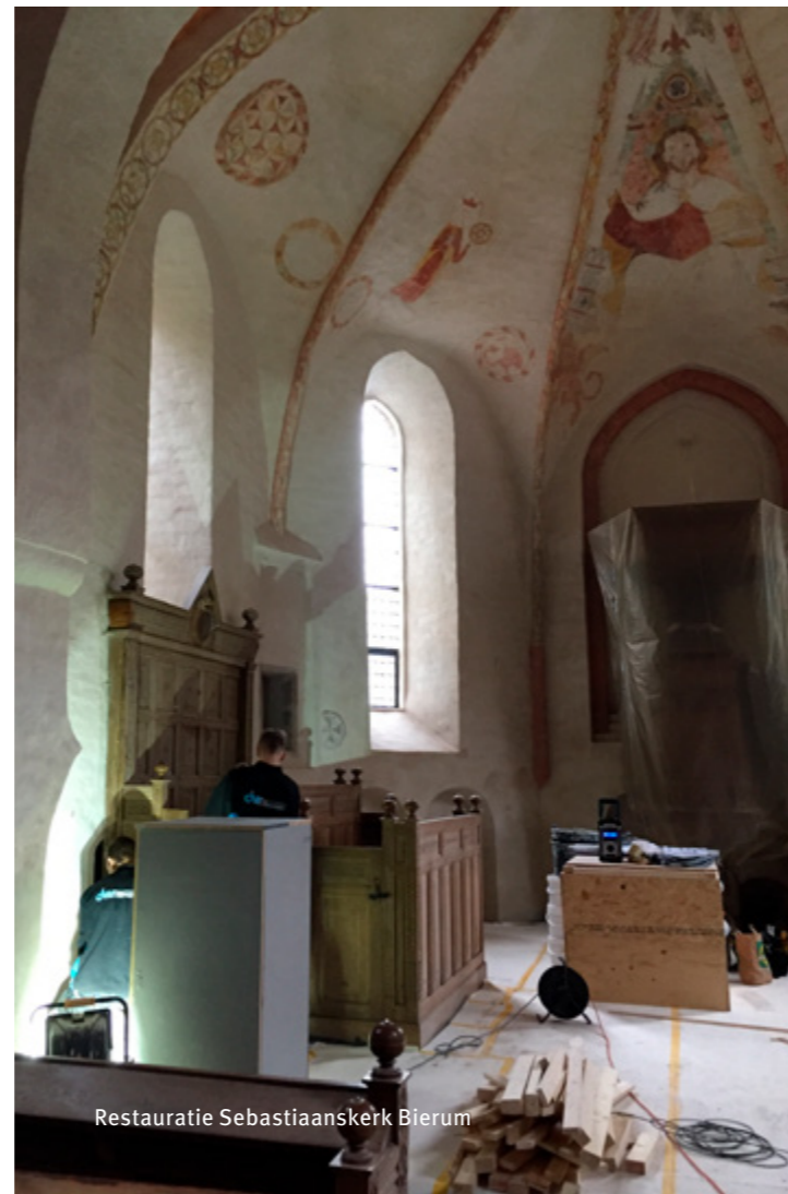
Restauratie Sebastiaanskerk Bierum

Grensoverschrijdend is het project Schoolkerk in Garmerwolde. Hier komen alle aspecten waar de stichting zich voor inzet bij elkaar: instandhouding, restauratie, verduurzaming, educatie, leefbaarheid en toerisme. Niet voor niets werd dit project meermalen genomineerd door verschillende instanties die innovatie en verduurzaming van het cultureel erfgoed nauwlettend volgen en stimuleren. Dit project leidde er ook toe dat de Stichting Oude Groninger Kerken de prijs won voor Goed opdrachtgeverschap waarmee alle her- en doorbestemmingen werden bedoeld die er over de afgelopen jaren hebben plaatsgevonden. De prijs was geïnitieerd door platform GRAS in samenwerking met de stadsbouwmeester van Groningen, Jeroen de Willigen.