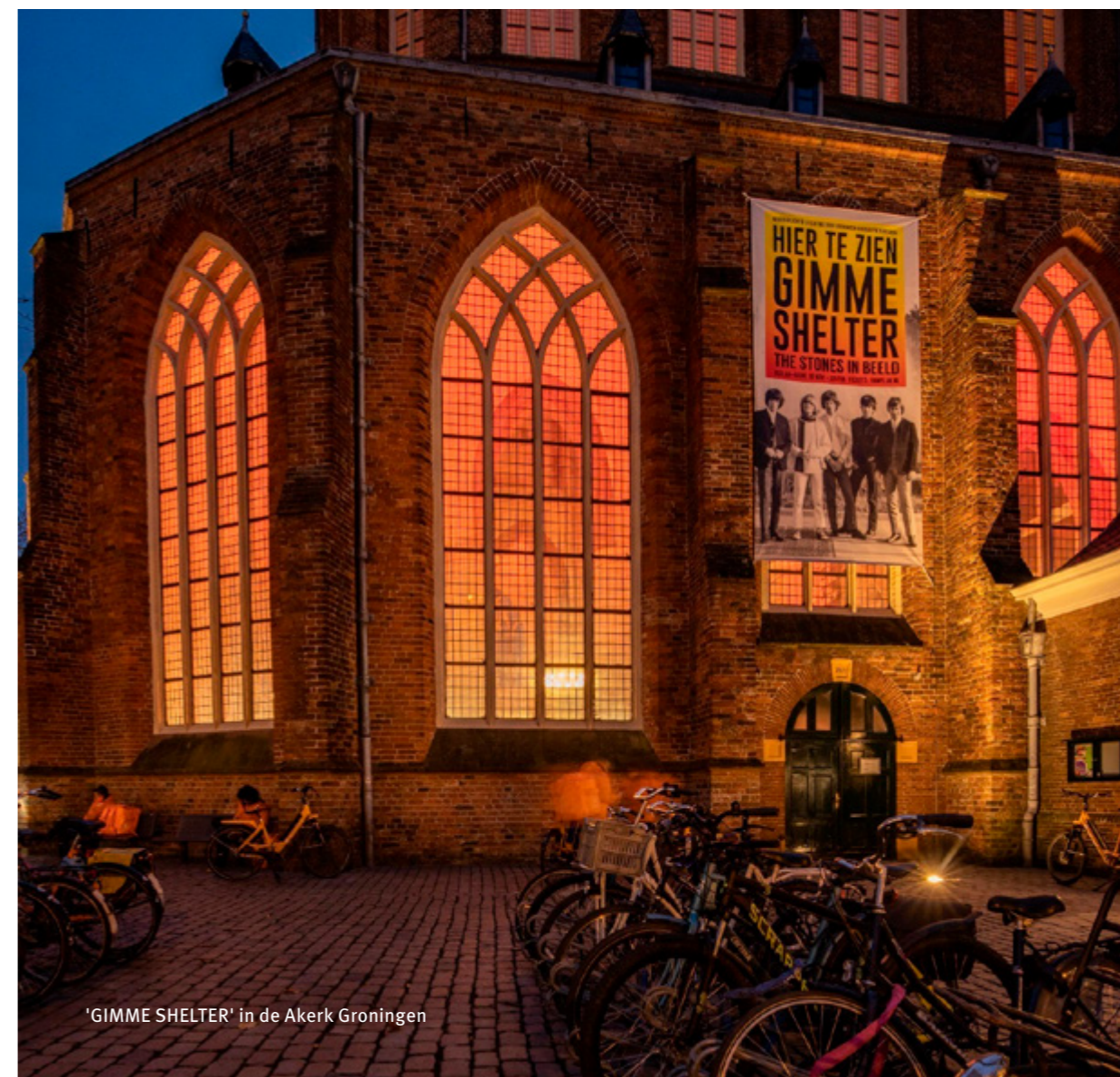
'GIMME SHELTER' in de Akerk Groningen

De digitalisering van onze gegevens wat betreft de roerende goederen, de kerkhoven en documenten in de mediatheek als restauratiedagboeken en archiefonderzoeken, heeft dit jaar, naast de verdere uitbreiding van onze beeldbank, de nodige aandacht gekregen. Wat betreft de roerende goederen vindt dit plaats in het kader van 'Kerkcollectie digitaal' van Museum Catharijneconvent in Utrecht. Resultaten van dit omvangrijke werk zijn beter zicht- en vindbaar op onze geheel vernieuwde website. Wij presenteren topstukken uit onze collectie op www.collectiegroningen.nl , een samenwerking van alle erfgoedorganisaties in de provincie Groningen. Digitaal, in hoge kwaliteit en rechten-vrij, voor iedereen toegankelijk.