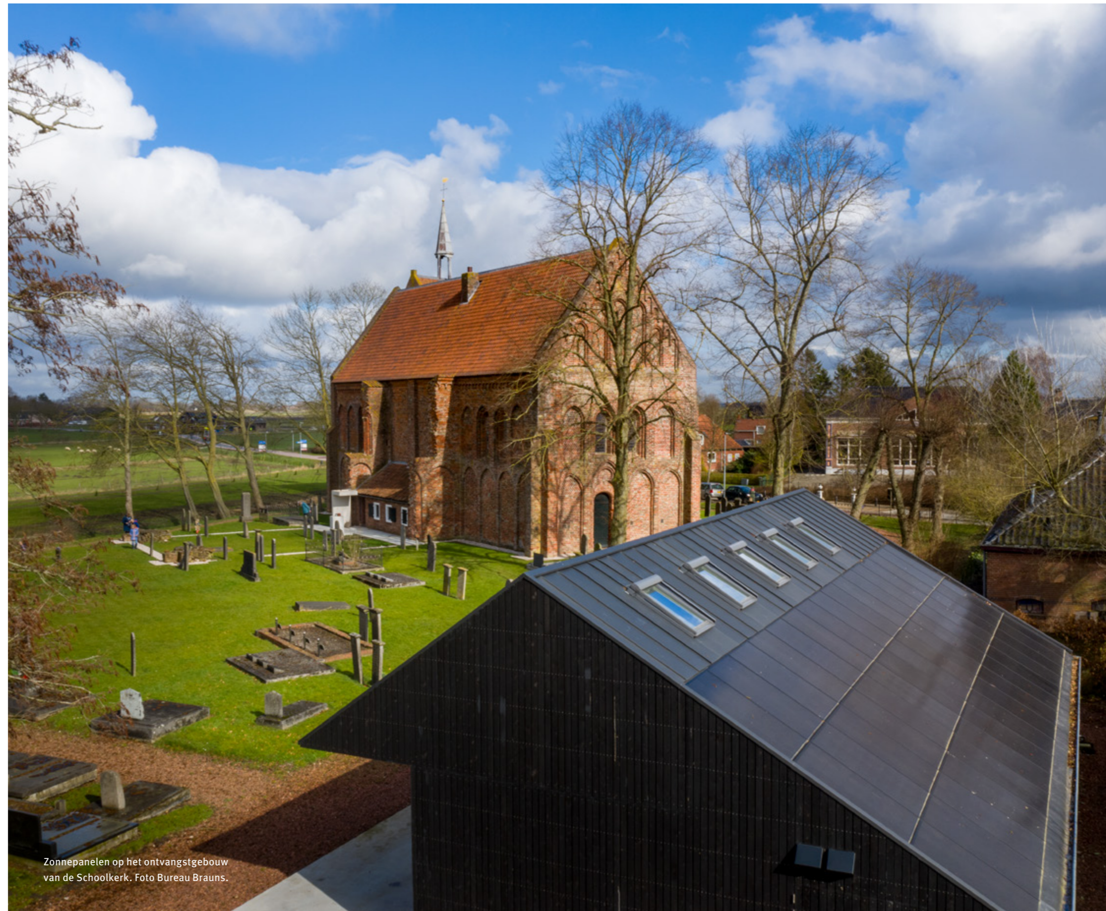
Zonnepanelen op het ontvangstgebouw van de Schoolkerk.

Het erfgoed van de Stichting Oude Groninger Kerken draagt bij aan onze identiteit. Van oudsher speelt religie een rol in ons dagelijks leven, zowel voor gelovigen als voor niet-gelovigen. De geschiedenis maakt wie wij zijn en is van invloed op hoe we naar de toekomst kijken. Jaren werd er gewerkt aan de Schoolkerk in Garmerwolde, waar erfgoed, religie, duurzaamheid en samenleving met elkaar verbonden worden in de tentoonstelling Feest in Oost en West! . Deze tentoonstelling maakt deel uit van het grotere project Feest! Weet wat je viert dat door het Museum Catharijne-convent werd geïnitieerd en hier een eigen invulling vond in de toren bij de kerk. De spectaculaire verbouwing, verduurzaming en inrichting werden feestelijk geopend op 28 februari. Helaas moest de kerk zijn deuren twee weken later weer sluiten als gevolg van corona. De scholen die de tentoonstelling zouden bezoeken hebben hun bezoek uitgesteld en we hopen ze in het schooljaar 2021-2022 allemaal te kunnen ontvangen.