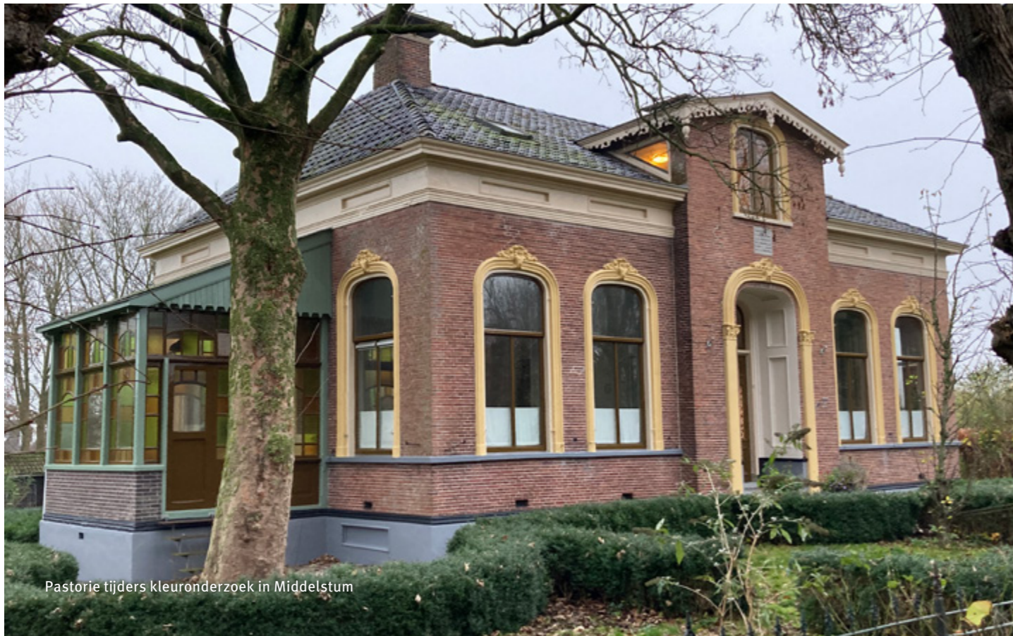
Pastorie tijdens kleuronderzoek in Middelstum