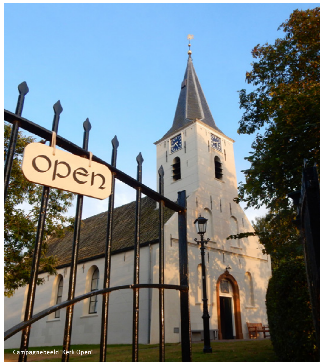
Campagnebeeld 'Kerk Open'

Om mensen in heel Nederland bewust te maken van het unieke erfgoed in het noorden, richtte in juni/juli 2020 de donateurscampagne 'Wordt het dit jaar Marseille of Marsum' zich met een kwinkslag op de thuisblijvers. En met resultaat. Aan het eind van het jaar ontwikkelde de stichting een meer contemplatieve campagne waarbij de focus lag op verwondering voor ons erfgoed. Deze was zowel te zien op driehoeks-borden in de hele provincie als in advertenties en spotjes op tv.