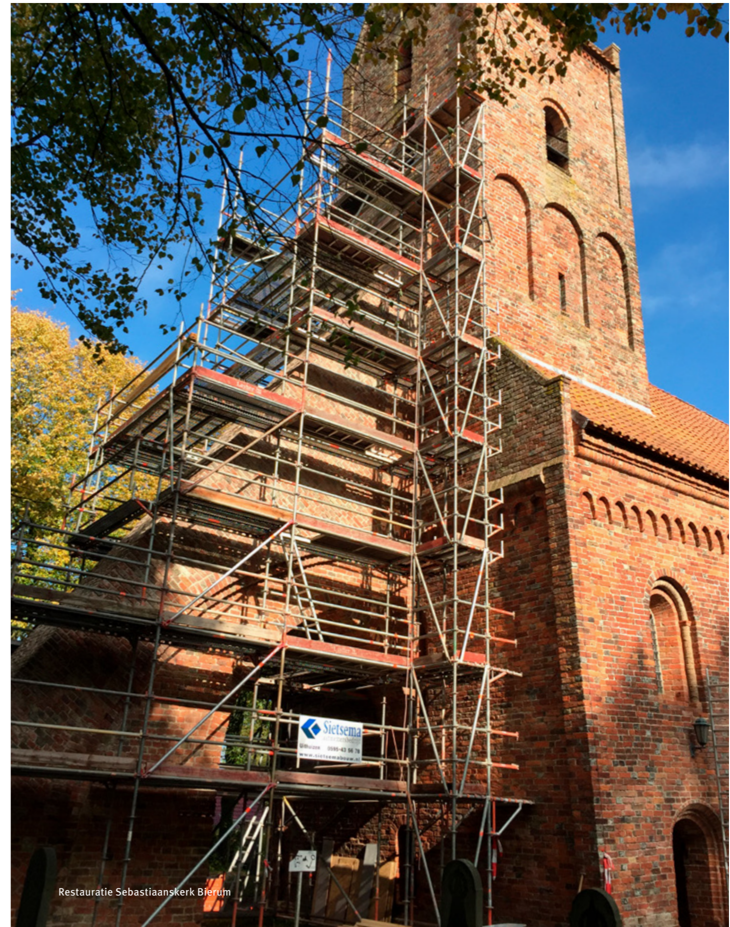
Restauratie Sebastiaanskerk Bierum