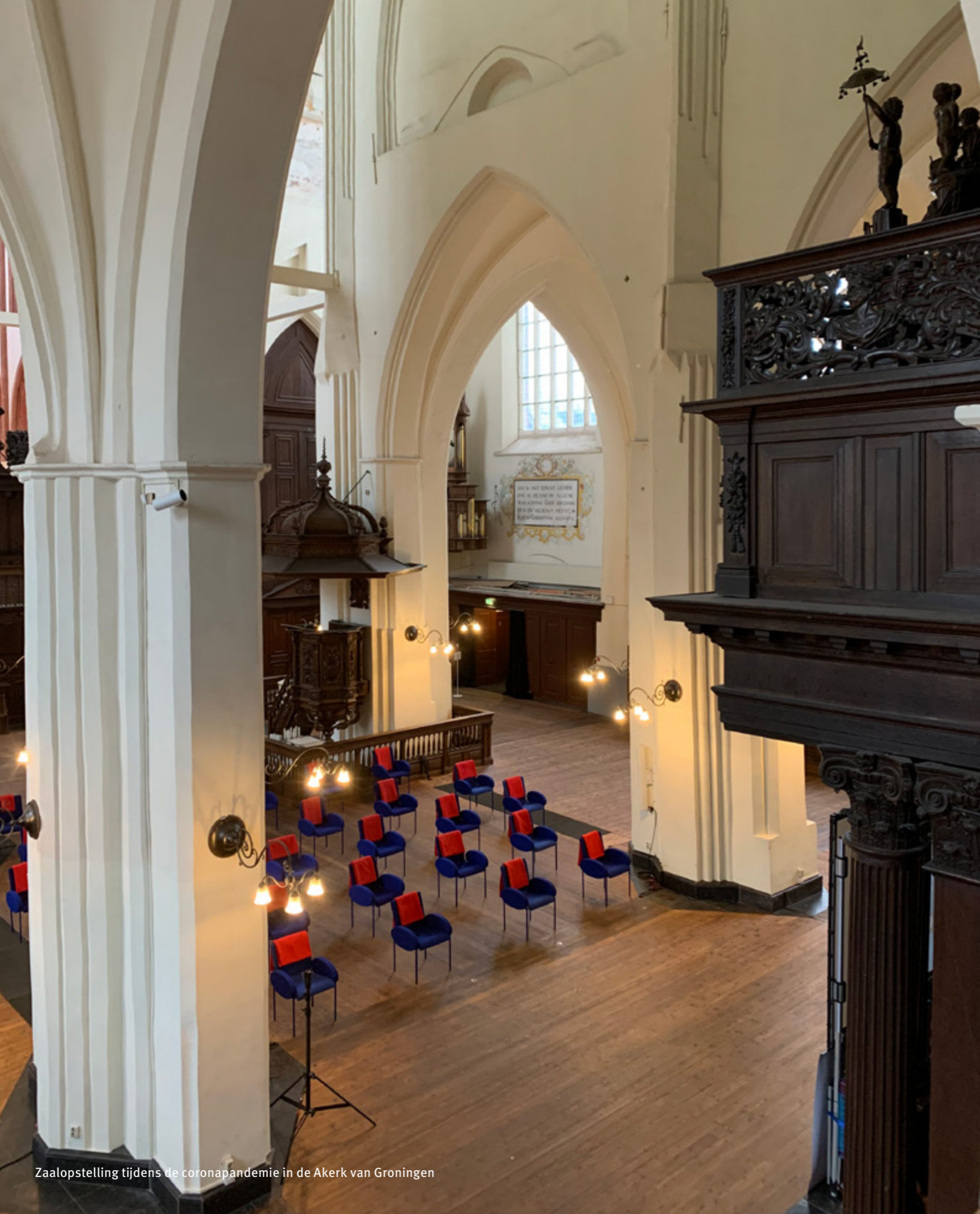
Zaalopstelling tijdens de coronapandemie in de Akerk van Groningen