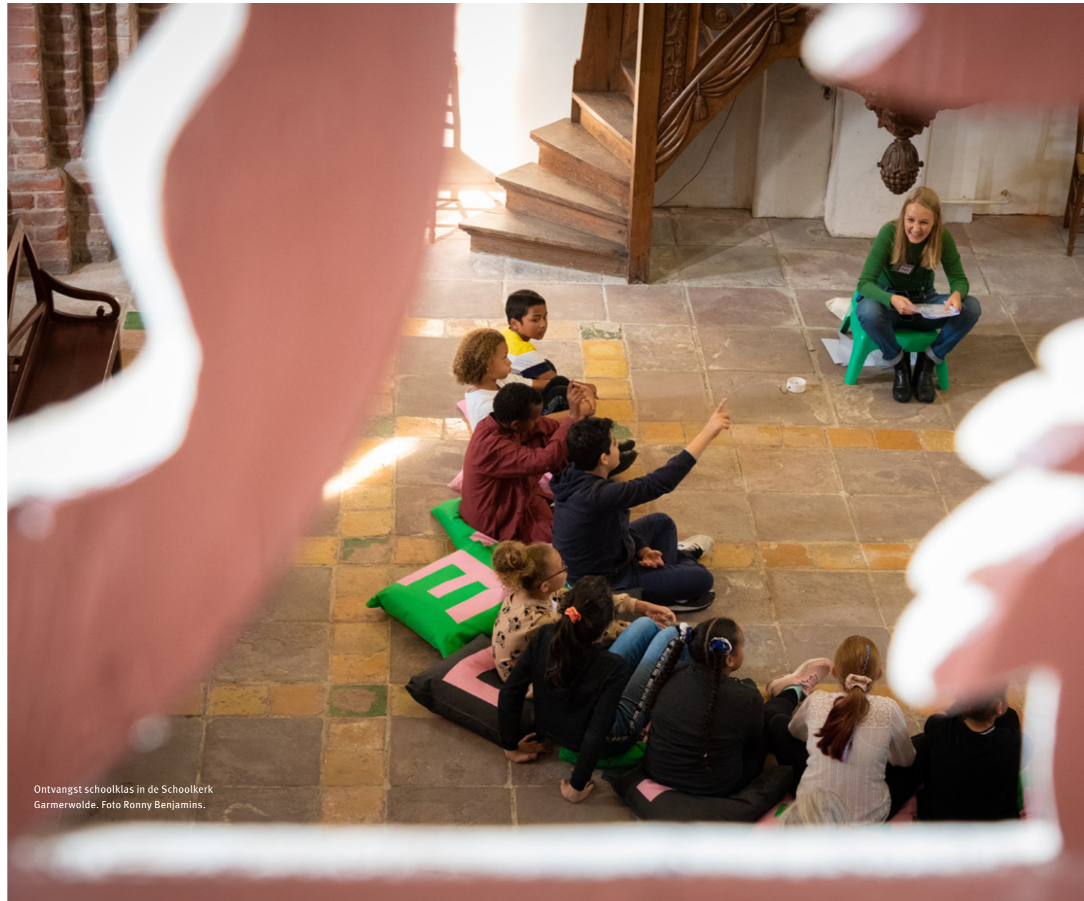
Ontvangst schoolklas in de Schoolkerk Garmerwolde.

Met het netwerk Future for Religious Heritage heeft de Stichting Oude Groninger Kerken een internationaal, Europees platform om zowel de instandhoudingsprojecten van de Groninger kerken als ook de educatieve activiteiten onder de aandacht te brengen van een breder publiek en internationaal werkende erfgoedprofessionals. Doel van dit netwerk is niet alleen kennisuitwisseling, maar ook het tot stand brengen van toekomstige samenwerkingen.