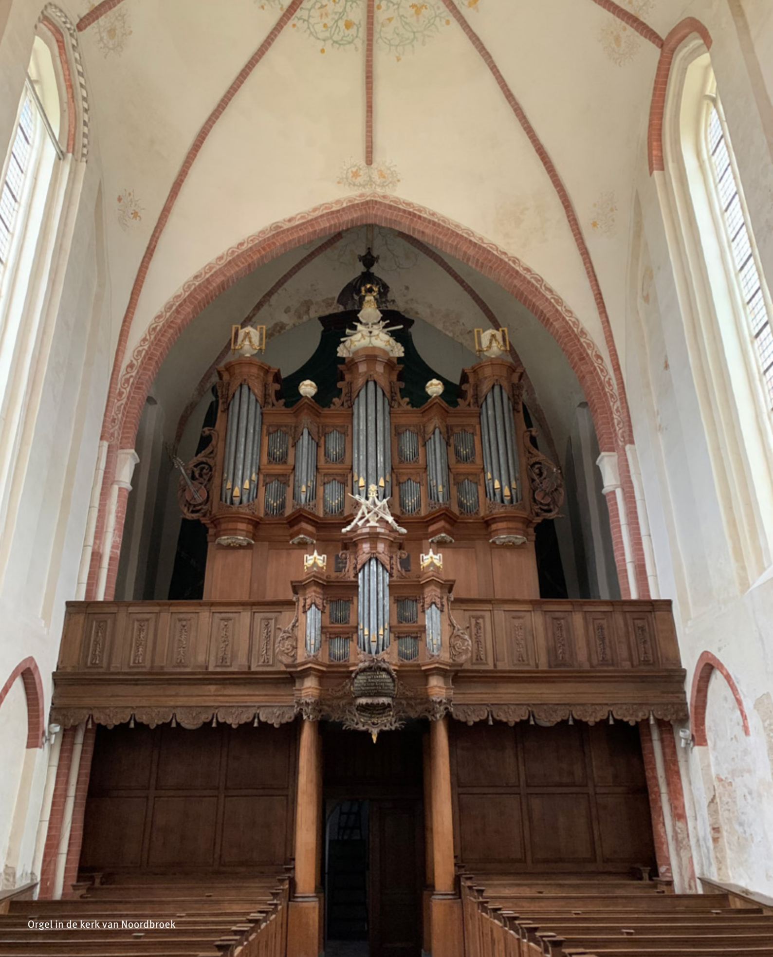
Orgel in de kerk van Noordbroek