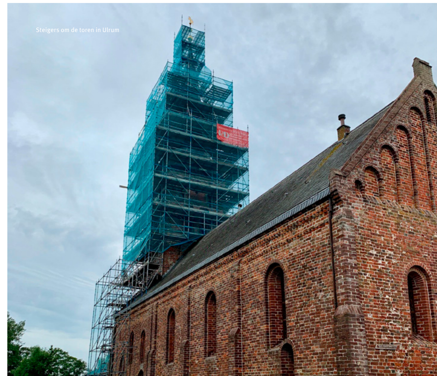
Steigers om de toren in Ulrum

Mijnbouwschade aan de Gereformeerde kerk in Bedum werd afgerond. Nog juist aan het eind van het jaar kon herstel van mijnbouwschade aan de kerken van Spijk en Ulrum aanvangen. In beide gevallen in combinatie met restauratie of onderhoud.