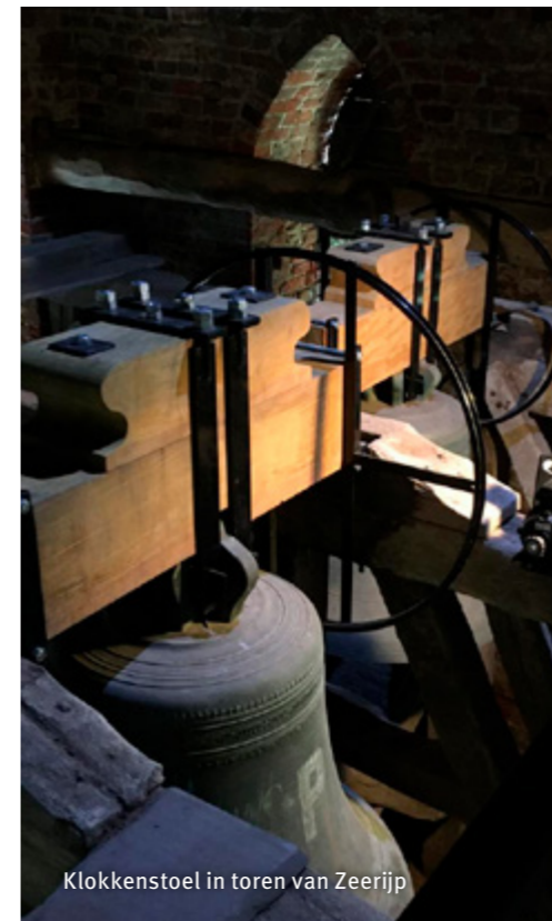
Klokkenstoel in toren van Zeerijp