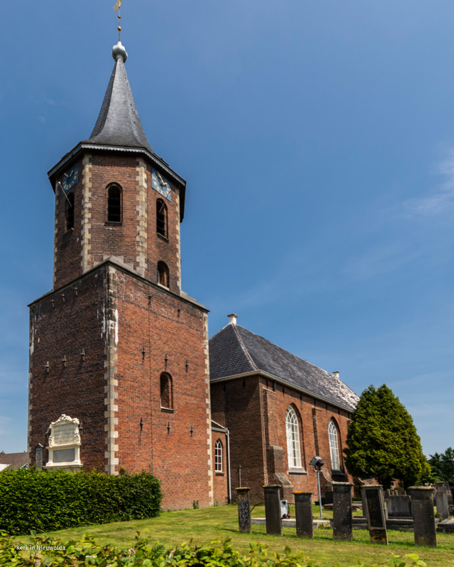
Kerk in Nieuwolda