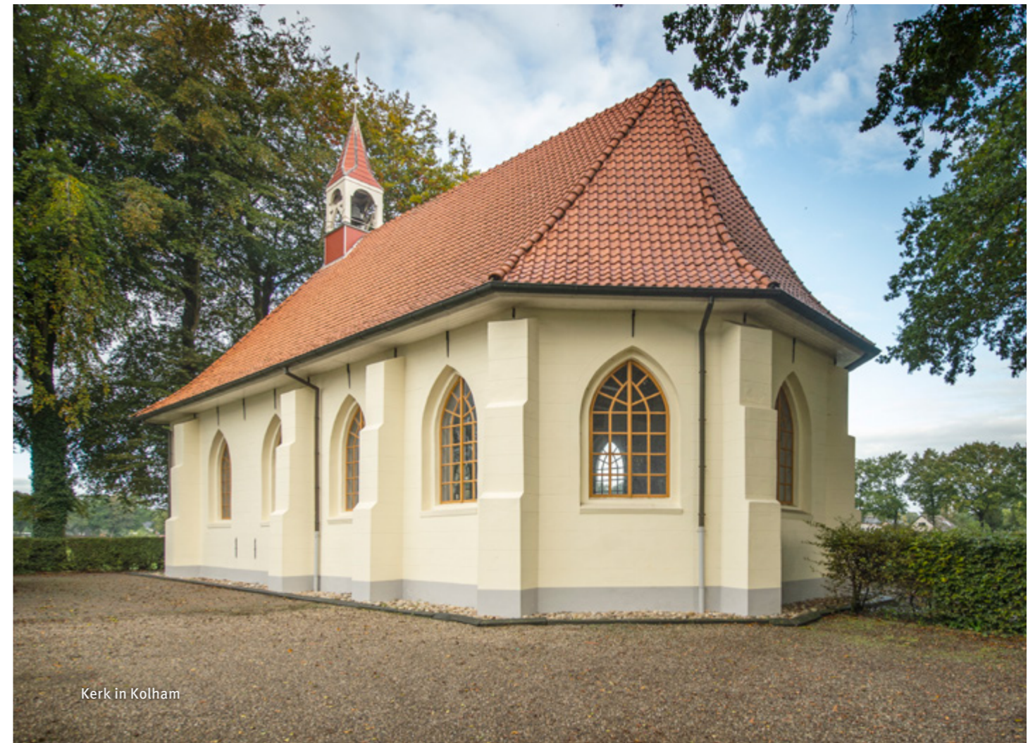
Kerk in Kolham