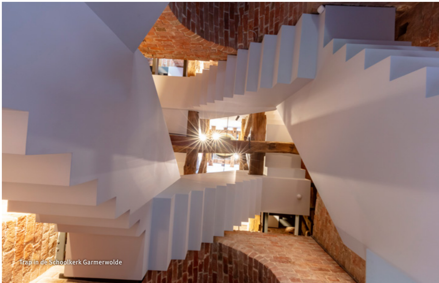
Trap in de Schoolkerk Garmerwolde