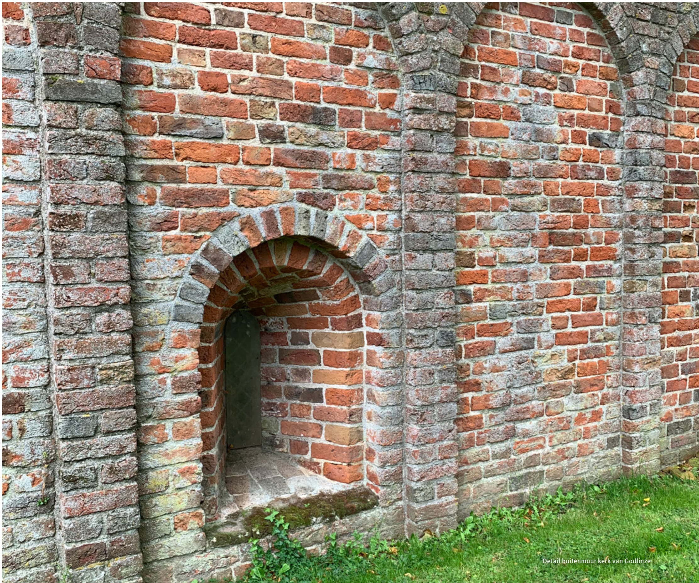
Detail buitenmuur kerk van Godlinze