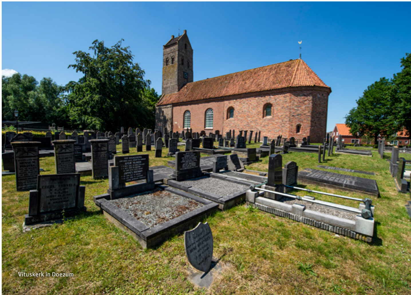
Vituskerk in Doezum

De kerk in Doezum is oorspronkelijk gewijd aan Sint-Vitus. Vitus is een heilige en martelaar van de rooms-katholieke en de orthodoxe Kerk. Vitus is de beschermheilige van dansers, zangers en epileptici, en in Nederland schutspatroon van Het Gooi.