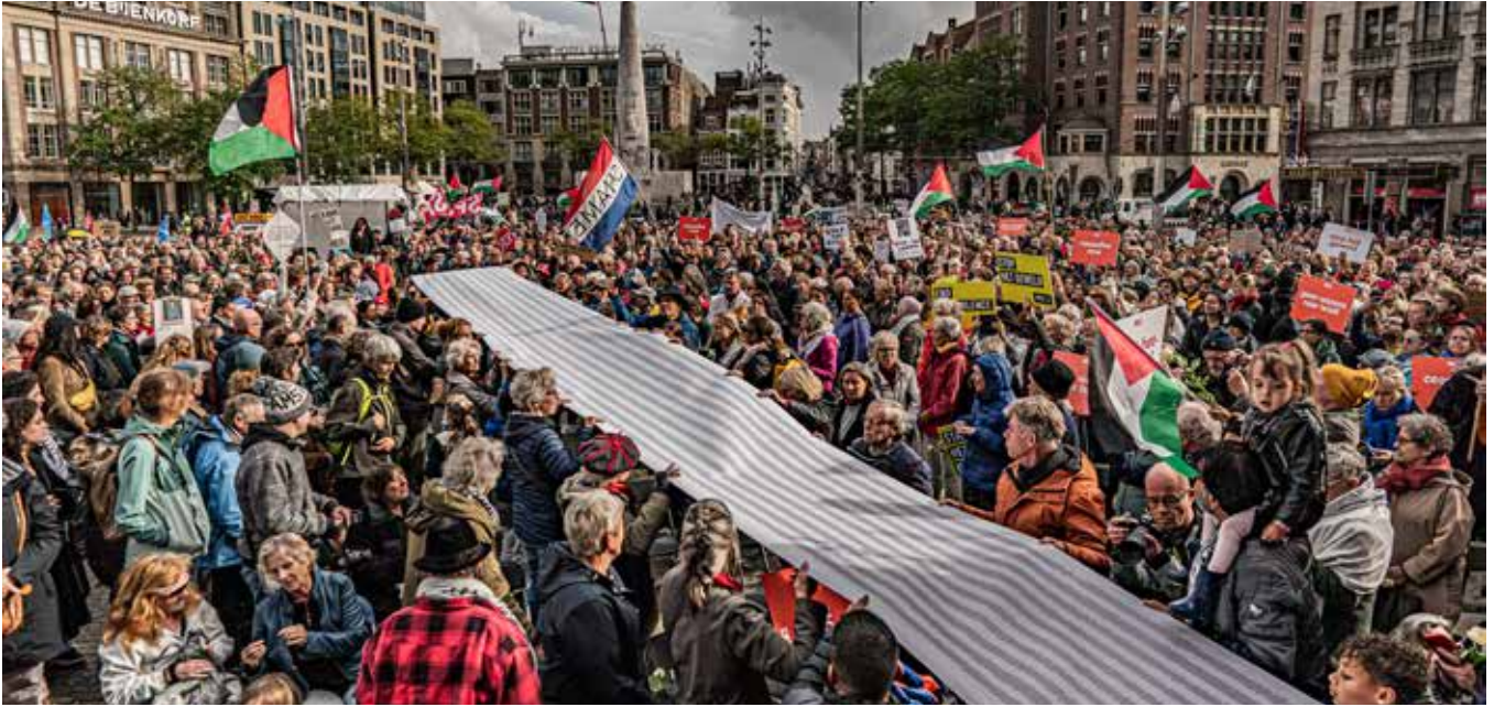
▲ Manifestatie Stop het Geweld op 13 oktober in Amsterdam