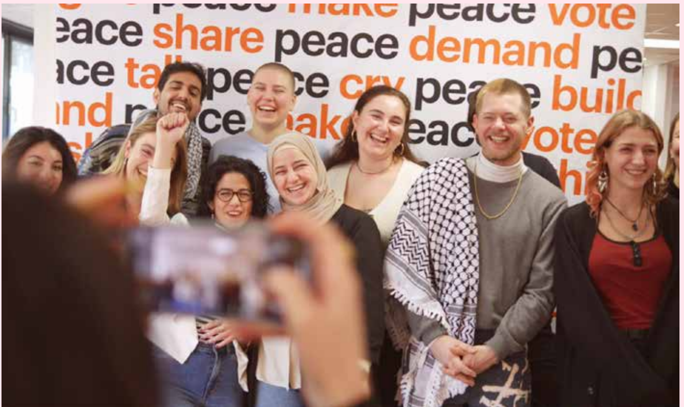
▲ Deelnemers van de PAX Activist Academy

Met de PAX Activist Academy versterken we jonge activisten die zich inzetten voor vrede en rechtvaardigheid. Door trainingen in geweldloze actie, lobbyen en campagnevoeren vergroten zij hun kennis en invloed, waardoor zij effectiever kunnen bijdragen aan sociale verandering en een rechtvaardige wereld.