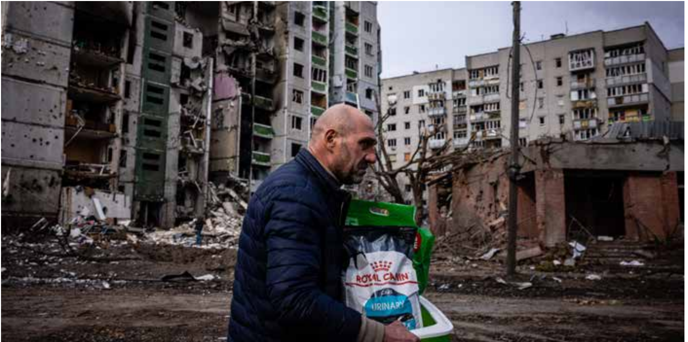
▲ Een man loopt langs een woongebouw dat beschadigd is door beschietingen in de stad Tsjernihiv