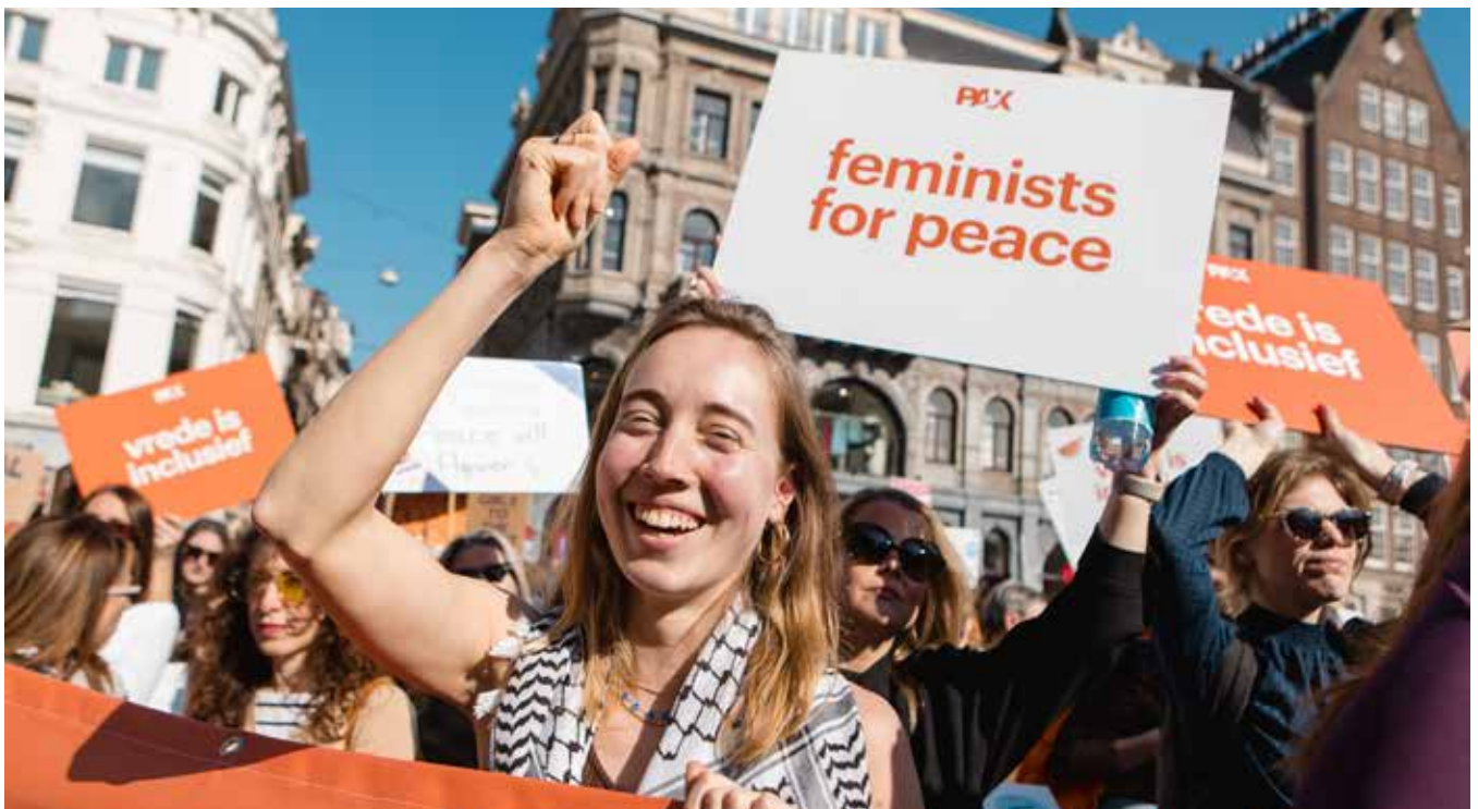
▲ Demonstrant bij de Feminist March