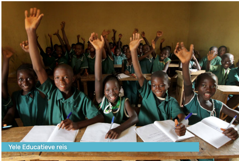
Yele Educatieve reis