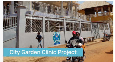
City Garden Clinic Project