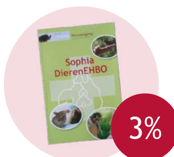
Handboek Sophia DierenEHBO