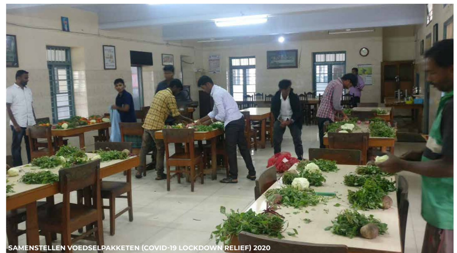
SAMENSTELLEN VOEDSELPAKKETEN (COVID-19 LOCKDOWN RELIEF) 2020