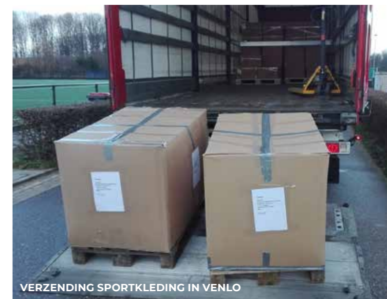
VERZENDING SPORTKLEDING IN VENLO